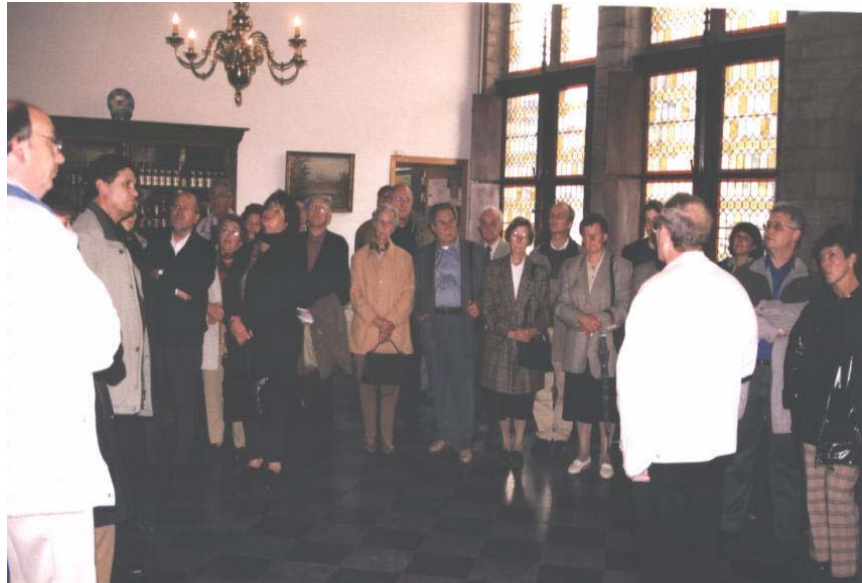
Empfang in Zoutleeuw im Rathausaal